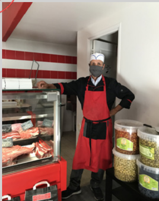
Un nouveau boucher a ouvert ses portes cet été à Survilliers.